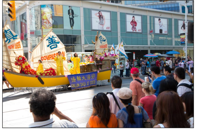
图：法轮功学员和民众在多伦多市中心举行大游行

权——正发生在中国的严重人权践踏。”他说，“随着越多人知道迫害，将会有越来越多的人与你们站在一起抗争，直到我们都有自由。”