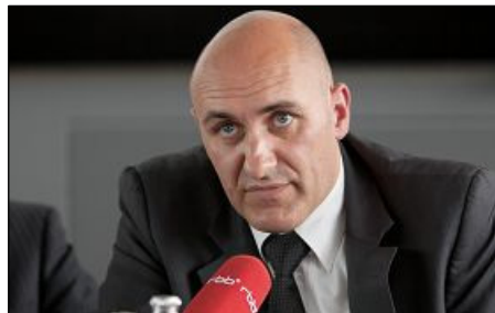
图：反强摘器官医生协会发言人法国医生金认为活摘器官完全背离医学原则

二零零六年三月初，中共在沈阳市苏家屯秘密集中营关押六千名法轮功学员并摘取活体器官的暴行被海外媒体曝光，英国器官移植学会伦理委员会主席史蒂芬·威格摩尔教授随即谴责在中国的器官移植是一项“无法接受”的侵犯人权行为，并呼吁联合国及世界卫生组织展开调查。