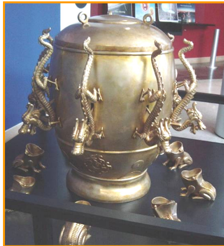
图：中国古代科学异常发达。东汉时期张衡发明了世界上第一台预测地震的候风地动仪，比欧洲早 1700 多年。

如果说宇宙万物是神创造的，那么一个人要探索宇宙的深层奥秘，就要信神敬神，按照神的要求修身养性，淡泊名利，提高自身的道德修为。