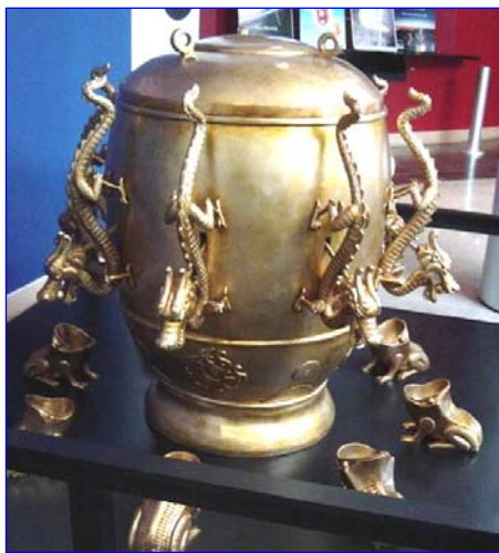
图：中国古代科学异常发达。东汉时期张衡发明了世界上第一台预测地震的候风地动仪，比欧洲早 1700 多年。

宇宙的奥秘比人间的国家机密更玄妙和深奥，但是能不能够认识到宇宙奥秘，并不是人人平等的。有没有类似的捷径呢？答案是肯定的。