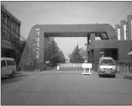
德阳监狱，对外又称德阳市九五厂

（13）会见：即亲属接见。按监狱规定，每月可接见亲属两次。但对法轮功学员的亲属却例外。许多学员