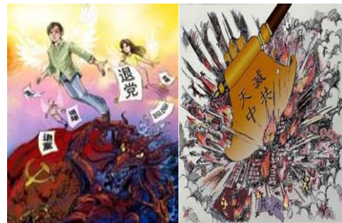
天要灭中共三退保平安