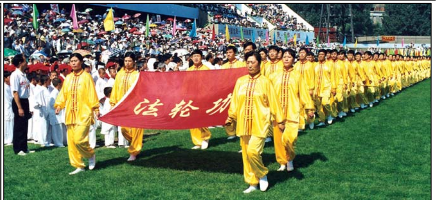
左图：李洪志先生为《文艺之窗》的题词；中图：《人民公安报》肯定法轮功；右图：沈阳亚洲体育节上展风采