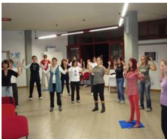
真察诺小镇的民众学习法轮功第二套功法