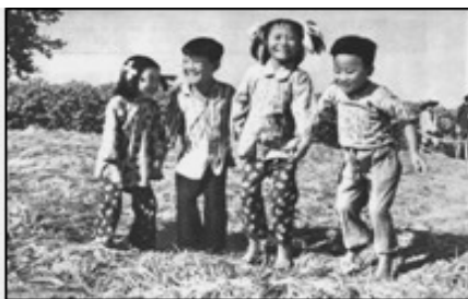
上图：压不倒的稻子。当年中共为渲染亩产万斤，连篇刊登如此“新闻”，小孩站在稠密的稻子上面，稻子不倒。