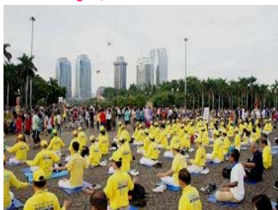
法轮功学员在雅加达中央公园集体炼功

用海外电子信箱给 freeget.ip@gmail.com 发电子邮件，10 分钟内会拿到几个 IP 地址（标题不可空白）。突破网络封锁 访问明慧网 www.minghui.org 了解更多真相！