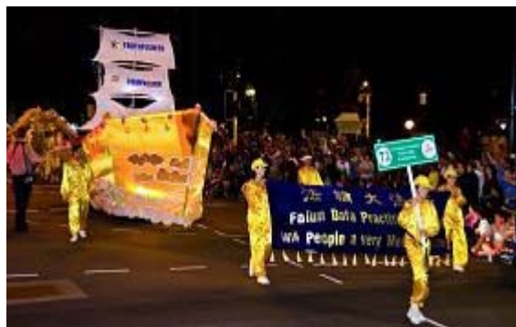
法轮功学员参加珀斯市圣诞大游行