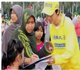
雅加达民众在了解了真相后签名支持