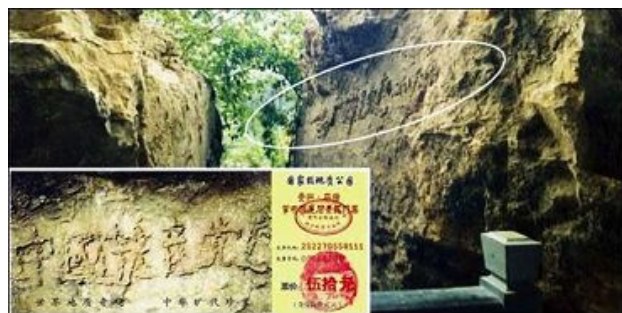
大图为藏字石的断裂面，小图为风景区的门票。

天怒人怨，奇石昭示着“天灭中共”，《九评》唤醒了民众。作为中国人，从儿童入队到入团、入党，就被要求举着右手发誓“为某党奉献终生”，这等于发毒誓将生命交给了中共，世界上没有第二个组织要求人在加入时发这样的毒誓。那么天灭中共之时，没有解除毒誓（没“三退”）的人就会失去宝贵的生命。这就是法轮功学员为什么要讲真相，并把“三退”保平安的天机告诉世人的原因。