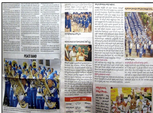
图：印度各大媒体大篇幅报导法轮大法天国乐团的新闻