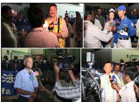
图：台湾天国乐团团员与印度学员分别接受印度电视台采访。

天国乐团还前往三所学校弘法，在第三所女子学校弘法，该校校长已在学炼法轮功，并推广给学生们在中午休息时炼功，学校图书馆也有大法经书。乐团演奏后，全体学生一起展