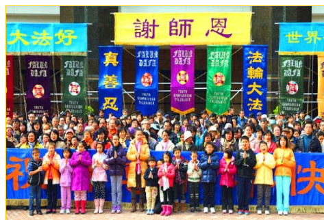
图：香港法轮功学员问候师父新年好

【明慧网】二零一三年元旦，明慧网整理发表大量中国大陆及海外大法弟子和世人恭祝李洪志师父元旦快乐的贺词和贺卡。其中来自大陆的贺信涵盖各地区、各阶层、各行业的法轮大法修炼者和明白真相的世人。这些贺信的传出，是借助“翻墙”软件，得以突破中共网络封锁，寄给明慧网发表。