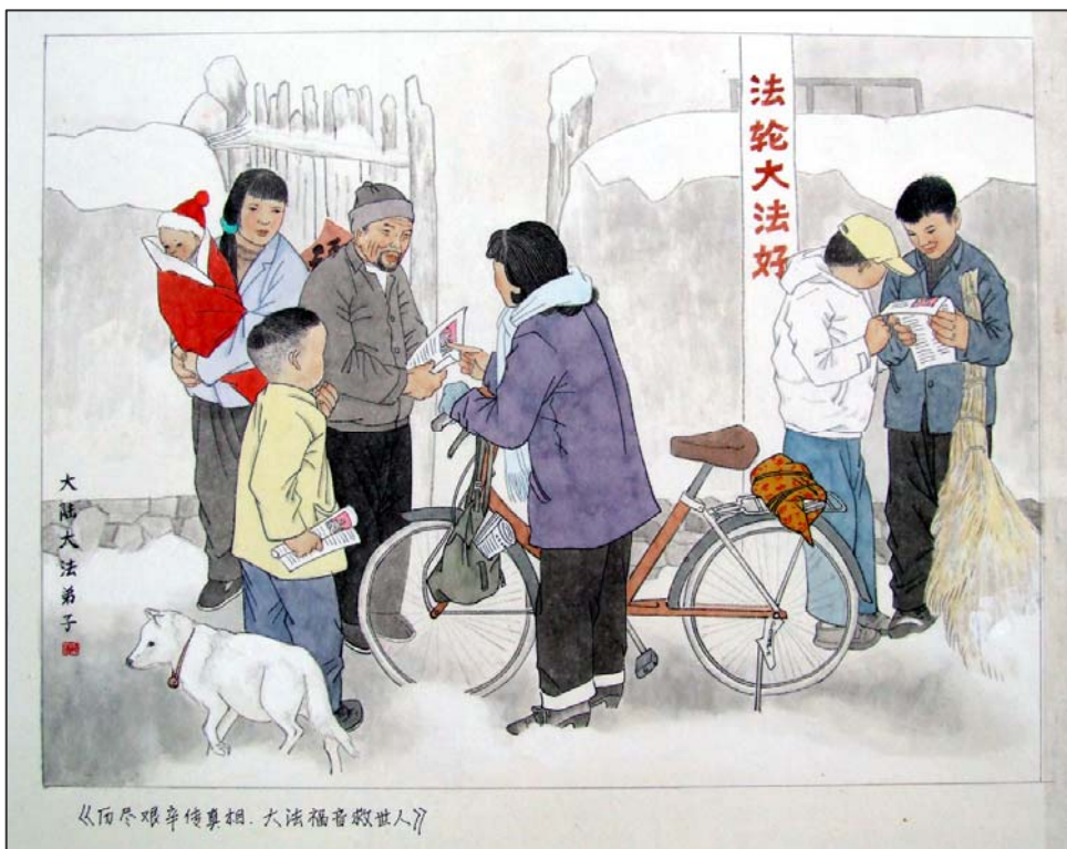
《百尽艰辛悔真相·大法福音救世人》

大戏散，各西东， 何去复何从？ 故人福祉挂心中， 祈愿再相逢。 歧路多，休惆怅， 大法指明方向。 一封真相破迷谎， 助你上慈航。