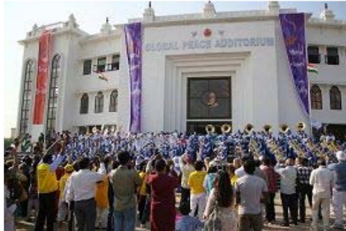
△天国乐团应邀至印度参加首届精神领袖会议开幕演奏

海得拉巴市有数种不同语言的报纸，都连续数日以大篇幅报导天国乐团的新闻。当地电视台也每天跟拍，并采访了印度学员与台湾学员，让电视机前的一亿多名观众知道，为何有这么多人修炼法轮功，并到印度来告诉大家法轮功的美好，以及天国乐团是因为修炼大法才能吹奏出