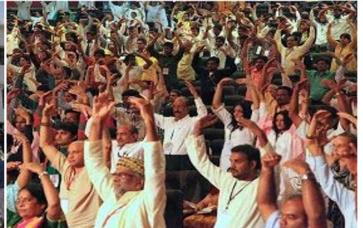
△参与精神领袖会议中的贵宾集体学习法轮功功法