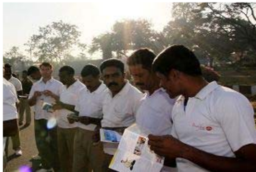
△印度警察们学习法轮功功法，并认真阅读真相传单