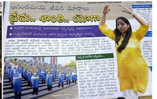
△印度各大媒体大篇幅报导法轮大法天国乐团的新闻