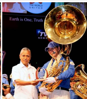
左：天国乐团应邀在印度首届精神领袖会议演奏；中：与会贵宾们集体学习功法；右：主办单位颁发奖座给天国乐团