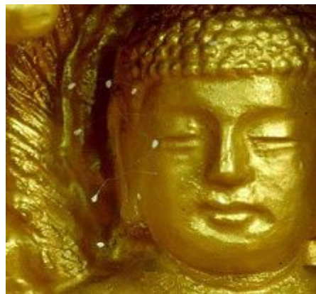
图: 韩国全罗南道顺天市海龙面须弥山禅院佛像上的优昙婆罗花。

2012 年 7 月 13 日早上 6 时, 在四川莲花镇莲花河里惊现朵朵莲花。“莲花”凭空由河底冒出, 起初是一个小小的气泡, 慢慢从河底往上升, 并渐渐扩散, 开始是一个圆形, 几分钟后花瓣便逐渐成形。花的直径约二十