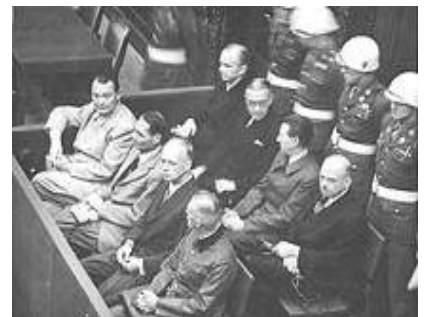
图: 纽伦堡审判图片。1945年二战结束后, 纽伦堡国际军事法庭否决了迫害帮凶们“奉命行事”的辩解。

如果追究起来, 那些幕后的人根本不会承认是他们领导、命令了这一次又一次的迫害。最后的证据, 就是“一线人员”错误运用法律, 侵犯了法轮功学员的合法权利。然后其党再叫嚣, 这些一线执法人员损害了“党”和国家的形象、给“建设事业”造成了巨大损失, 云云。那些参与迫害法轮功的人员可能没有想到, 中共在迫害法轮功的过程中, 早把他们当成随时可以抛弃的棋子。