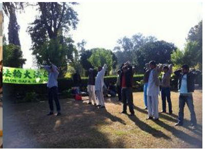
在巴基斯坦公园里介绍法轮功