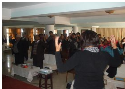
在尼泊尔介绍法轮功

在印度我们遇到很多流亡藏人, 他们冒着生命危险从中国逃到印度, 他们中很多人生活环境十分艰苦, 但几乎每个人对中共邪党认识都非常清楚, 一说三退马上就同意。我们问他们为什么这么苦的环境还要到这里, 他们告诉我们, 因为这里自由, 他们对信仰的坚守是非常令人难忘的, 但很多人不了解法轮功。我们遇到一位闭关二十年的修炼者, 送了他一本大法书, 他欣然接受, 当我们讲到法轮功是长功很快的高德大法时, 他眼睛都发亮。还有一位年轻藏人向我们学习了五套功法并拿走很多大法真相资料, 要为我们去派发这些资料。在印度的南部还有大型的洪法活动, 大法在印度已经扎根并不断的洪传。◇