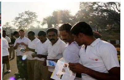
印度警察阅读法轮功真相资料