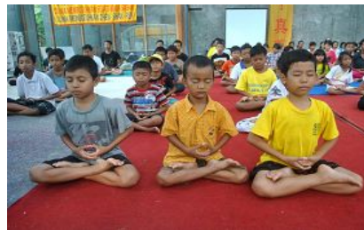
法轮大法小弟子们在炼静功