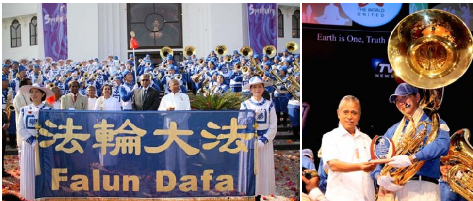
天国乐团应邀在印度首届精神领袖会议演奏 主办单位颁发奖座给天国乐团