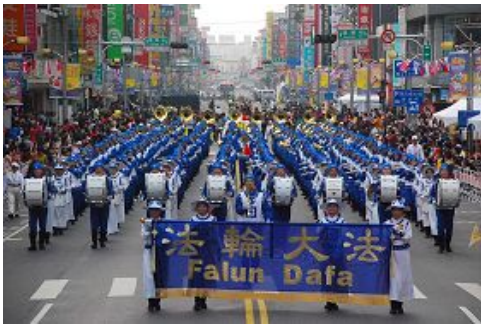
天国乐团行进在嘉义市中山路圆环

用海外电子信箱给 freeget.ip@gmail.com 发电子邮件（标题不可空白），10 分钟内会拿到几个 IP 地址。突破网络封锁，访问明慧网 www.minghui.org ，了解更多真相。