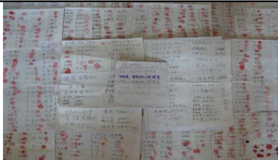
唐山及周边地区四千零一十一位民众的签名