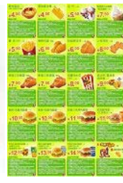
5: 肯德基优惠券折叠图