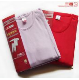
2: 三枪牌棉毛衫裤图