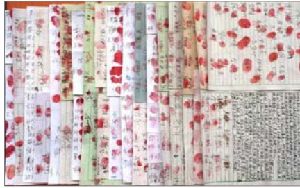
超过二千人签名声援

而从根本上说，选择迫害，这是中共的本质决定的。中共本质是“假恶斗”，和法轮功的“真善忍”是根本对立、水火不容的。这一点在迫害法轮功的13年中表现得淋漓尽致，中