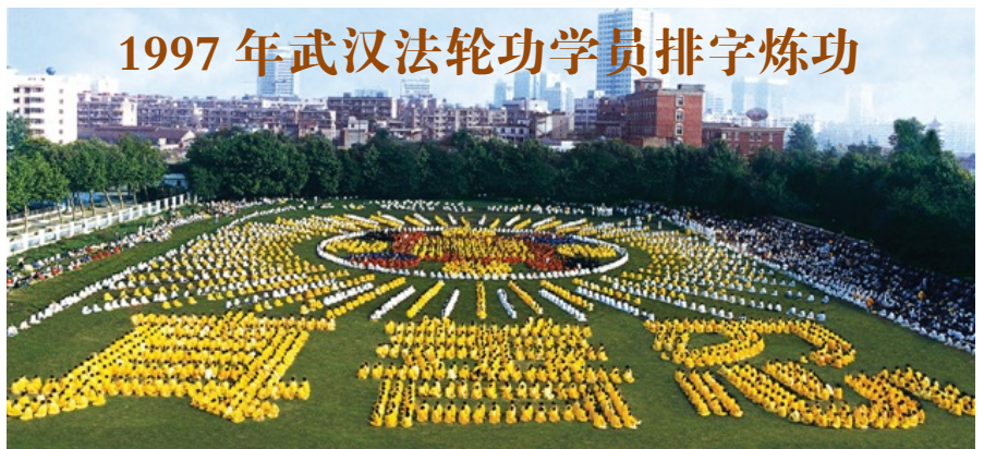
1997 年武汉法轮功学员排字炼功

中共肆意迫害善良民众的恶行，引发了湖南郴州众多百姓的强烈不满，有民众自发联名声援营救。目前有超过二千人签名声援营救被绑架的法轮功学员，呼吁严惩害人凶手（左上图）。