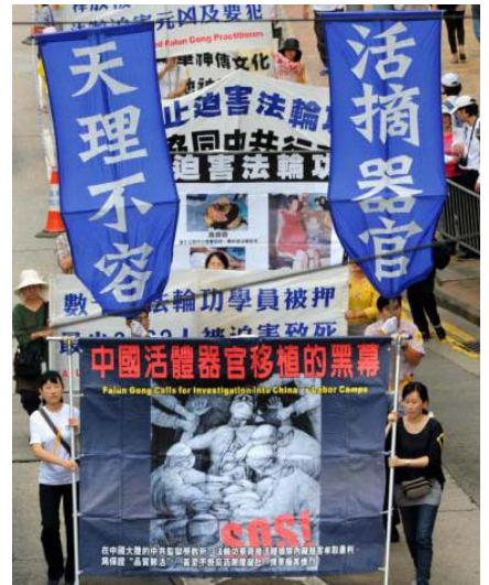
图：2012 年 10 月 1 日香港集会游行，声讨自 2001 始中共数以万计地活体摘取法轮功学员器官用以牟取暴利的滔天罪行。

2002 年 3 月 5 日晚长春电视插播“天安门自焚骗局真相”的吉林省法轮功学员生前遭受着中共酷刑——“性迫害”。多根电棍持续电击手心、脚心、头、颈、生殖器等敏感部位，痛苦让人生不如死。吉林大法弟子雷明曾被狠捏睾丸，疼得死去活来，长春大法