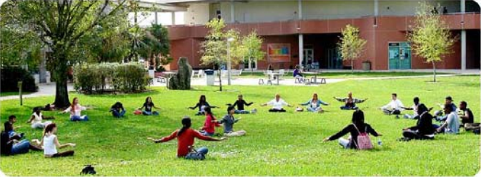
美国佛州大学学生们在草坪上学炼法轮功；达拉斯是美国第9大城市,2005年法轮功走进了这座以“牛仔城”著称的城市的中学课堂。