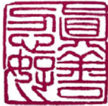
篆刻作品：真善忍好

那么谁真正是为人好、为国家民族好，又是谁想毁掉人，我们真的要冷静理智地分析，为自己和民族的未来做出正确的选择呀！