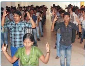
印度JB工程学院的学生在炼法轮功第二套功法