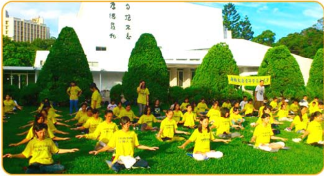
2012年8月，第13届法轮大法青年学子交流营在台湾清华大学举行，来自台湾各地的青年法轮大法修炼者汇聚一堂，交流修炼心得并在清晨集体炼功。