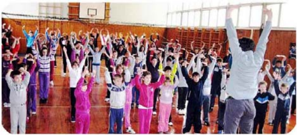
欧洲12所学校800名师生在炼法轮功