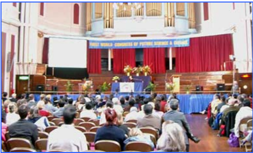
来自世界各地的专家学者济济一堂，向台下

早在 2002 年，法轮功就走进了剑桥大学。3 月 9 日由法轮功科学家修炼者为主体举办的“首届世界未来科学与文化大会”在学术传统悠久的英国伦敦学府剑桥大学隆重召开。