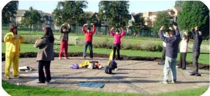
法轮功学员在剑桥大学的草坪中央炼功 9