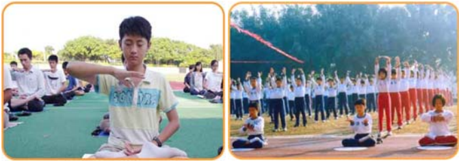
台湾多所中、小学校的学生在炼法轮功功法

巴甫洛夫后来是否直接介入大规模对人的试验不得而知，但列宁把巴甫洛夫的科学理论用于对苏联社会主义新人的改造，则是有目共睹的。从此以后，苏联开展的社会主义教育，让“公民们”言听计从，只要你不相信、不服从，你就有可能被发配到西伯利亚，甚至被处死。于是乎，只经历不到