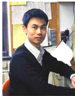
芝加哥大学吴伟标教授

26岁取得博士学位，开始在著名的芝加哥大学任教的吴伟标教授，29岁获得“美国自然科学基金”授予年轻科学家的职业奖，当年全美只有少数人在统计学领域获此奖。2009年，34岁的吴教授获得由诺贝尔经济学奖得主命名的“库普曼斯计量经济学奖”。