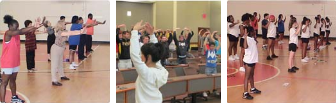
美国教授在炼法轮功第一套功法 美国新泽西大学学生炼法轮功 美国大学生在炼法轮功第二套功法