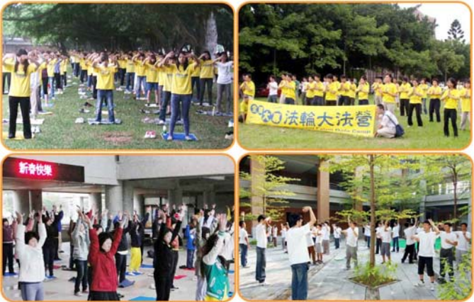
图为台湾多所大学的青年学子们在集体炼法轮功