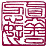
篆刻作品：真善忍好

那么谁真正是为人好、为国家民族好，又是谁想毁掉人，我们真的要冷静理智地分析，为自己和民族的未来做出正确的选择呀！