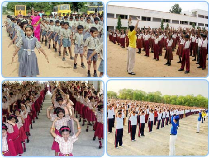
印度多所中小学学生及警官学院的大学生在炼法轮功

法轮功的主要著作《转法轮》中的首页文章——《论语》英文版被列入印度学校的教材中。