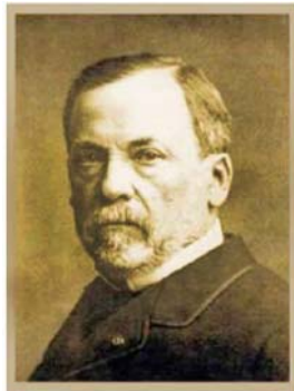
微生物学之父 巴斯德

名片上写着：路易斯·巴斯德，巴黎科学研究院院长。这学生遇到的是19世纪著名的科学巨人，世界一流的化学家和微生物学家，被誉为“微生物学之父”、“进入科