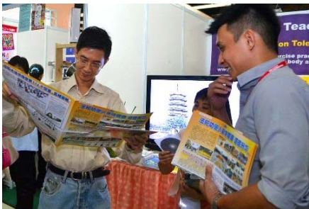
马来西亚民众在阅读真相资料

“2012年第九届国际健康展”于12月7日至9日在吉隆坡太子世界贸易中心举行，法轮功学员连续第四年参加该展览。