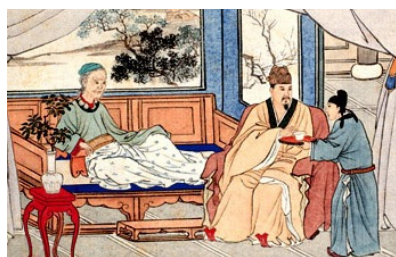
汉文帝为病重的母亲喂药