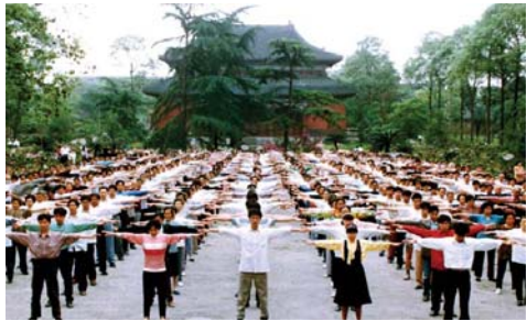
迫害前成都法轮功学员集体炼功