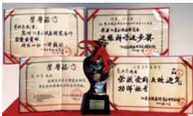
1993年北京健康博览会上，李洪志先生获“边缘科学进步奖”和“受群众欢迎气功师”称号。

● 教人向善 法轮功，又称法轮大法，是由李洪志先生于1992年5月传出的佛家上乘修炼大法，以“真善忍”为根本指导，包含五套缓慢优美的功法动作。法轮功教人向善，要求修炼者从做好人做起，努力按照“真善忍”标准提升道德水平。修炼法轮功不但能祛病健身，还能使人变得诚实，善良，宽容。 ● 福益社会 1998年下半年，前人大老干部对法轮功进行了数月的调查，得出“法轮功于国于民有百利而无一害”的结论，并向中央政治局提交了调查报告。 ● 法轮大法弘传世界 法轮功至今已弘传一百多个国家和地区（包括台湾、香港、澳门），法轮功的书籍被译成30多种语言出版发行，并可在互联网上免费下载。李洪志先生和法轮大法获得各国政府各类褒奖、支持议案和支持信函3000多项。“真善忍”的信仰得到了各族裔民众的爱戴和尊敬，却在中國大陸一地受到残酷迫害。