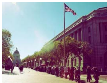
旧金山市政府前，流浪者排队领取免费食品。

住所上。而 2007 年，美国已经为流浪者建造了四万多个配有基本家电的公寓房。对于流浪儿童，美国政府则把他们“寄养”在正常的家庭中，给予补贴，并有专门人员定期查看孩子们的生活情况。