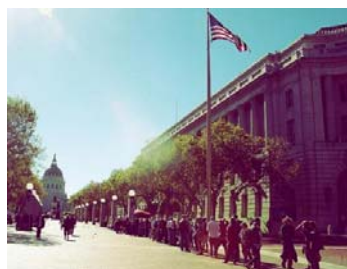
旧金山市政府前，流浪者排队领取免费食品。

住所上。而 2007 年，美国已经为流浪者建造了四万多个配有基本家电的公寓房。对于流浪儿童，美国政府则把他们“寄养”在正常的家庭中，给予补贴，并有专门人员定期查看孩子们的生活情况。