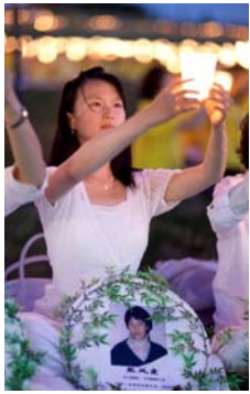
截至 2013 年 1 月 已知迫害致死的 法轮功学员人数 达到 3638 人。

关于山村优秀教师遭绑架一事，在当地和教育界引起很大反响，人们都替董老师鸣不平，纷纷气愤地说：“这年头，共产党不做善事，没有人权，坏人趾高气扬，好人反被迫害”。◇