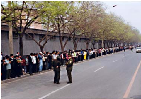
4·25 上访民众秩序井然，安静自律， 警察在一旁悠闲地聊天。

社准备发声 明更正之际， 4月23日，天 津市突然出 动防暴警察 300多名，殴 打和非法逮 捕法轮功学 员，致使学员 流血受伤，40