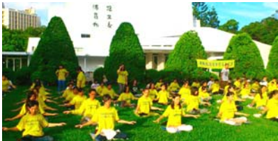
2012 年 8 月，第 13 届法轮大法青年学子交流营在台湾清华大学举行，来自台湾各大学的法轮功学员在清晨集体炼功。