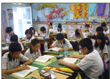
同学们午休阅读《转法轮》