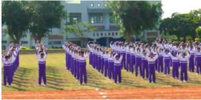
台东县都兰国中全校学生集体炼功