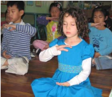
豆豆园的孩子们在炼功

“豆豆幼儿园”有什么神奇的秘方呢？他们非常注重传统文化和品德教育，而最重要的是他们的教育理念——“真善忍”。除了一般幼教课程外，这里还开设了学习法轮功的课程，孩子们在阅读法轮功书籍的过程中明白了如何按照“真、善、忍”做一个好人，炼功打坐使孩子们能够静下心来，使