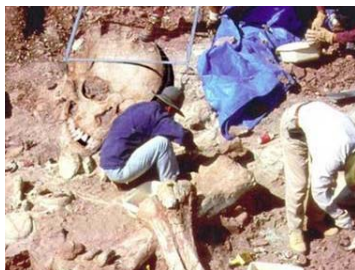
考古学家在南美洲的智利挖到的巨人骨骼

五十年代后期，土耳其的山谷地区发现了许多巨大骨头化石。经调查证实，与人的骨头十分近似，只是比例