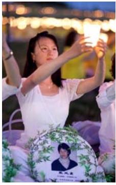
截至 2013 年 1 月 已知迫害致死的 法轮功学员人数 达到 3638 人。