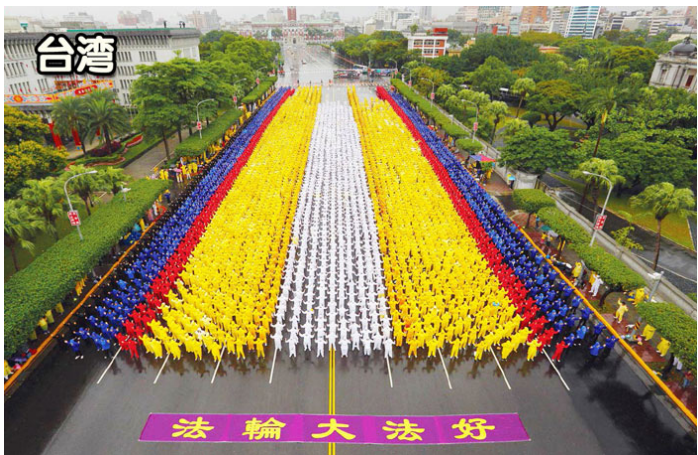
2012 年 11 月 17 日，6000 名法轮功学员在总统府前炼功