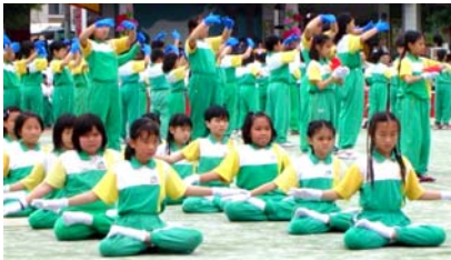
台湾花莲县明义国小在集体炼功

法轮功自 1995 年传入台湾，呈现蓬勃发展的景象，修炼者超过六七十万人，遍及各行各业。特别是在教育界，许多县市在寒暑假举办“法轮功教师研习营”，使众多校长、教师走入修炼法轮大法的行列；国立台湾大学、清华大学、中兴大学、中正大学等大专院校的四五十个法轮功社团相继成立；明慧豆豆园、十几个县市中小学的“明慧班”及法轮功夏令营，在台湾学生们的心中播下了“真善忍”的种子，使他们健康快乐地成长。