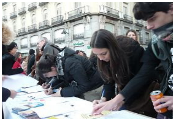
西班牙法轮功学员在太阳门广场举行反迫害征集签名

【明慧网二零一三年一月二十六日】二零一三年一月十九日下午，马德里法轮功学员们在市中心太阳门广场举行征集签名的活动，呼吁停止在中国对法轮功学员的残酷迫害。学员们将揭露中共残酷迫害法轮功学员的图片展板摆放在人来人往的广场，拉开写有“解体中共，制止迫害”的大横幅，并向过往民众发放传单，详细讲述事实真相。人们对在中国发生的对法轮功学员长达十三年的残酷迫害表示愤怒和无法理解，他们不明白为什么中共要这样对待一群修炼真、善、忍的好人。