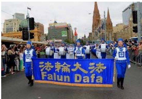
法轮功学员参加墨尔本的盛装游行

【明慧网二零一三年一月二十九日】（明慧记者夏纯清澳洲墨尔本报道）二零一三年一月二十六日是澳洲国庆日，澳洲“文化之都”墨尔本举行盛装游行。法轮大法团体参加了该活动，天国乐团的演奏威武雄壮，气势恢弘，吸引观众纷纷拍照留念，并表示，天国乐团的表演很出众，能在国庆日欣赏到，更是难得。