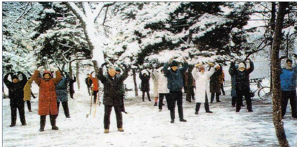
图：一九九六年长春法轮功学员集体炼功