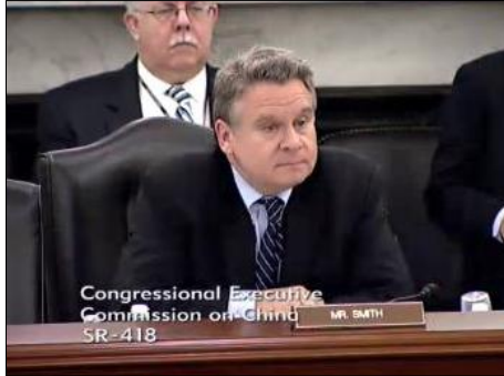
图：美国国会及行政当局中国委员会主席克里斯·史密斯议员

国际非政府人权机构“自由之家”资深研究分析师萨拉·库克女士分析了中共为什么要发动对法轮功的迫害。法轮功修炼人数的不断增加，法轮功“真、善、忍”的原则与中共意识形态的差异，让中共感到威胁，加上中共独裁者江泽民的个人妒嫉，于是在九九年发动了迫害。库克认为，中共对法轮功的迫害与中共几