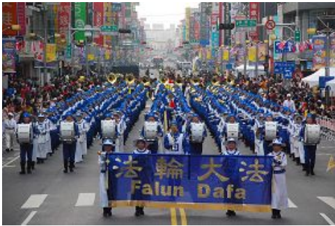
天国乐团行进在嘉义市中山路圆环