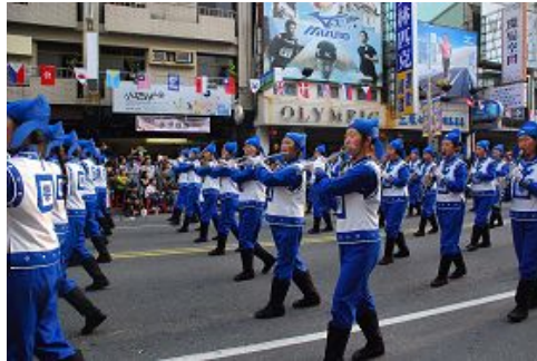
着唐装的天国乐团吸引民众的目光