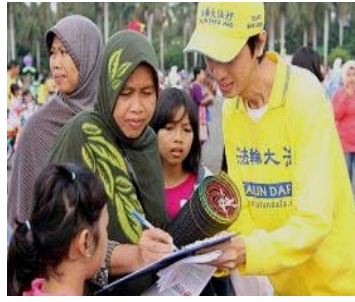
雅加达民众在了解了真相后