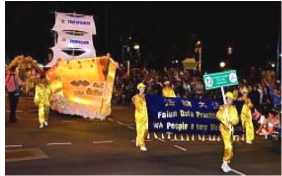
法轮功学员参加澳洲西珀斯市圣诞大游行