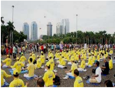
法轮功学员在雅加达

用海外电子信箱给 freeget.ip@gmail.com 发电子邮件 (标题不可空白), 10 分钟内会拿到几个 IP 地址。突破网络封锁, 访问明慧网 www.minghui.org 了解更多真相!