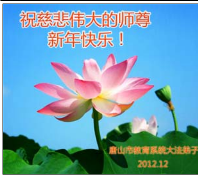
图：来自大陆的贺卡