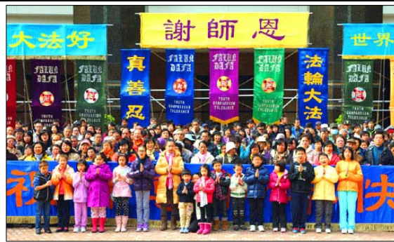
图：香港法轮功学员问候师父新年好