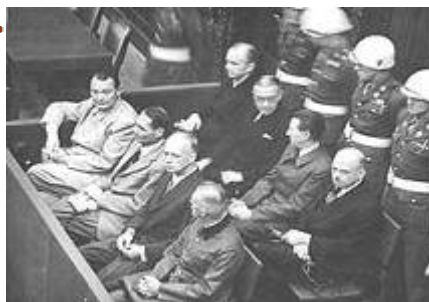
图：纽伦堡审判图片。1945年二战结束后，纽伦堡国际军事法庭否决了迫害帮凶们“奉命行事”的辩解。

其实中共在迫害法轮功的过程中，“不提供书面文件依据”的本身，就为“一线人员”将来当替罪羊埋下了伏笔。如果追究起来，那些幕后的人根本不会承认是他们领导、命令了这一次又一次的迫害。最后的证据，就是“一线人员”错误运用法律，侵犯了法轮功学员的合法权利。然