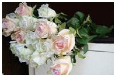
■“中国制造”的塑料花

珍最后表示:“我希望所有中国的法轮功学员早日获得自由,希望全世界的有良知的人能一起制止这场邪恶的迫害。”◇