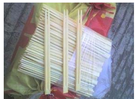
■ 恶劣条件下包装的“卫生”筷

《俄勒冈人报》在得知这个消息后通知了联邦移民海关执法局（ICE），该局下属的国土安全调查部门已经启动对这个案件的调查。出售这个产品的 Kmart 公司的母公司西尔斯控股公司发表声明说，他们将调查这个案件，一旦发现中国合作公司使用强迫劳动，将终止合同。◇