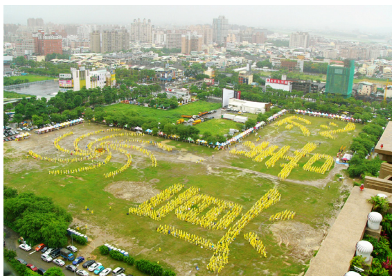
台湾法轮功学员集体炼功排字

“翻身坐起来。”母亲真就坐起来了，接着师父让她向前弯腰，我母亲真就弯下腰去。师父让她绕着舞台跑两圈，母亲真的就能跑起来，而且兴奋地跑