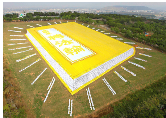
台湾法轮功学员炼功排字 展现巨著《转法轮》

大姐对外甥女说：“四舅姥炼法轮功，原来不能自理都好了，四舅姥爷也从病痛中摆脱出来了，咱们也跟四舅姥炼法轮功吧。”小外甥女欣然答应。当时也没住院，左大臂在三院骨科打上帘子用绳挂在脖子上就回家了。第十九天到我家跟我母亲学炼法轮功功法，当时带帘子“抱轮”（炼功动作）就坚持半个小时，回家后几天就把帘子拆下来了。手臂也不痛了，到医院检查黑的骨头完全康复，大姐家的一片乌云散了，又恢复了往日的欢乐。