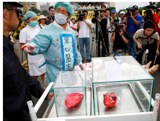
台湾学员模拟展示中共活摘 贩卖法轮功学员器官

义工接话道：“共产党犯下这样的大罪，‘天要灭中共’。”几个人异口同声：“该灭！”义工说：“后面还有一句话呢，知道吗？‘三退’保平安。”几个人听了立时表示：“退，全都退！”