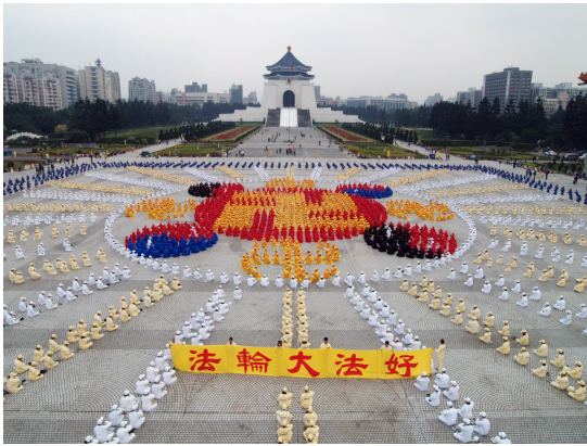
台湾学员集体打坐排字

“我打电话是想告诉你，我得福报了！”语气中充满了兴奋。女儿也高兴地说：“快说说。”高老太在电话里继续说，“你走后，我有空儿就念‘法轮大法好，真善忍好’，而且还一直听你们给我的那个小收音机（可以播放