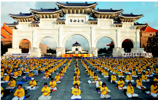
台北自由广场法轮功学员晨炼

二零零九年三月份，外孙用电脑给姥姥放零九年的神韵光碟。老人趴在显示器前入神地观看，演出第二个节目就是舞蹈《婆罗花开》，老人知道当优昙婆罗花开的时候转轮圣王就下世传法度人。当主持人介绍世界各地都有这种花开放时说：“婆罗花开了，神佛归来