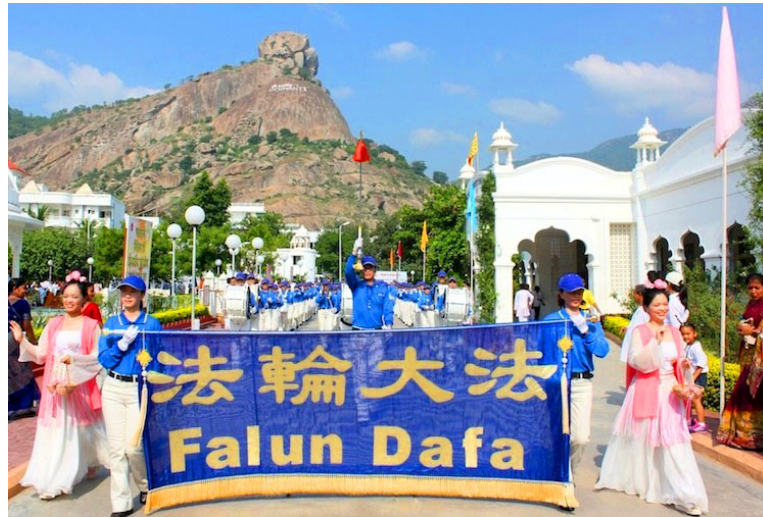
天国乐团在印度阿布山下演奏 右图：主办单位向天国乐团代表颁发奖牌并献上哈达