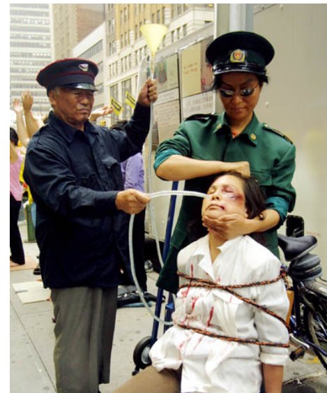
酷刑演示图: 野蛮灌食, 图为海外法轮功学员在美国纽约市中心进行反酷刑展, 演示中共野蛮灌食酷刑。野蛮灌食是中共残害法轮功学员常用的酷刑手段之一。