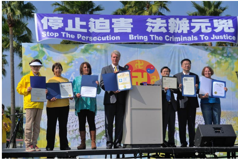
图:二零一三年十月二十日,法轮功学员汇集在洛杉矶海滨城市长滩举行集会,揭露中共反人类罪行,多位政要出席集会发言,集会还收到多位议员发来的嘉奖信与颁发的褒奖。

人类的希望,一致要求中共立即停止迫害,停止活摘法轮功学员器官的反人类罪行,并呼吁人们远离中共邪恶、摒弃邪恶,把作恶者绳之以法。