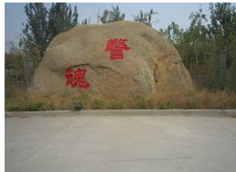
图：河南新乡邪恶洗脑班