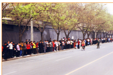
“4.25”上访现场之二。自始至终，上访群众自觉让出人行道和车道，静静地看书，等待。

1999年4月11日，前政法委书记罗干的连襟何祚庠在天津一杂志上撰文攻击诬蔑法轮功。天津部分法轮功学员前往相关机构反映实情。在杂志社和读者达成协议、即将友好解决矛盾之际，23日和24日，天津市公安局出动防暴警察，制造了首次法轮功学员流血事件，40多人被抓。学员们在天津市政府被告知：公安部介入了此事，去北京才能解决问题。