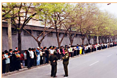
“4.25”上访现场之一。没有口号、标语，没有情绪激动。中央信访办周围秩序井然，警察在悠闲地聊天。