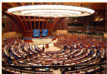
2002年7月24日,美国国会以420票全数通过188号决议,表达了对法轮功的和平性的肯定。这项决议还呼吁中国(江泽民集团)停止对法轮功学员们的迫害。

自1999年7月至今的15年来,法轮功学员和平反迫害,赢得了越来越多国家政府和民众的支持。例如: