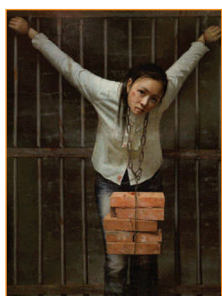
中共迫害法轮功学员的酷刑有40多种,极端残忍。左边的美术作品表现的是酷刑之一：吊砖。