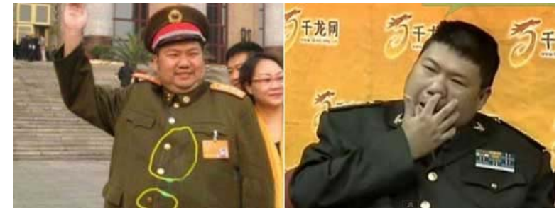
衣服上流口水、面对媒体抠鼻孔，毛新宇的智障在中国广为人知

不信神的人自然成不了神，毛泽东也不例外。毛泽东死后，同床共枕的江青马上被判死缓自杀身亡，唯一的嫡孙毛新宇也是个智障，自家人都保佑不了，还能保佑谁呢？