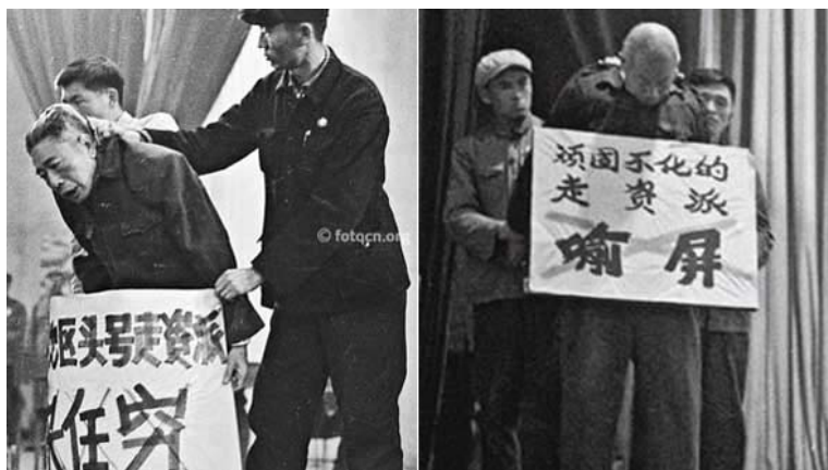
文革时期揪斗“走资派”

是坏事，我看穷是好事。越穷越要革命。人人都富裕的时代是不堪设想的……热卡太多了，人就要长两个脑袋四条腿了。”