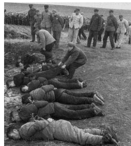
土地改革，全国杀了 200 多万地主

搞革命时，毛泽东承诺“耕者有其田”，后来推翻国民党政权，杀了几百万地主富农后，毛却搞起了合作化，农民的土地没分到几天就被收为国有，农民成了真正的无产阶级；