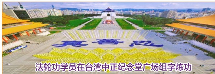
法轮功学员在台湾中正纪念堂广场组字炼功