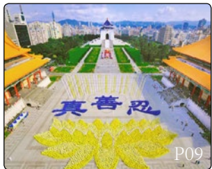
法轮功已传遍世界 100 多个国家和地区，图为法轮功学员在台湾中正纪念堂广场组字炼功。