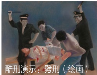
酷刑演示：劈刑（绘画）