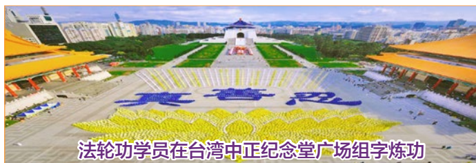
法轮功学员在台湾中正纪念堂广场组字炼功