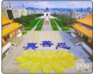
法轮功已传遍世界 100 多个国家和地区，图为法轮功学员在台湾中正纪念堂广场组字炼功。