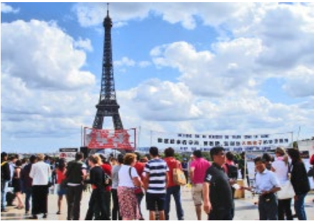
▲法国巴黎埃菲尔铁塔下，法轮功学员常年坚持讲真相，帮助中国游客“三退”

【明慧网】欧洲的旅游景点，中国游客常年不断，络绎不绝。多年来，退党义工们坚持在这里讲述真相，帮助大陆民众认清中共恶党，将三退（退出中共党、