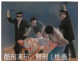
酷刑演示：劈刑（绘画）