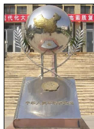
图左：中共酷刑折磨法轮功学员，同时掩盖罪行。图中：国际获奖纪录片《伪火》揭露了“天安门自焚”假案是中共导演的。中宣部制造了大量假新闻煽动民众仇恨，为中共迫害法轮功铺路。图右：“宪法顶个球”——当年的陕西省西北政法大学雕塑。中共迫害法轮功无任何法律依据。