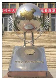
图左：中共酷刑折磨法轮功学员，同时掩盖罪行。图中：国际获奖纪录片《伪火》揭露了“天安门自焚”假案是中共导演的。中宣部制造了大量假新闻煽动民众仇恨，为中共迫害法轮功铺路。图右：“宪法顶个球”——当年的陕西省西北政法大学雕塑。中共迫害法轮功无任何法律依据。