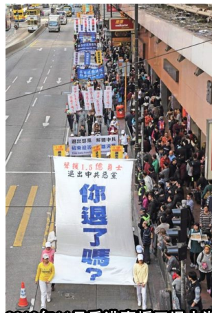
2013年11月香港声援三退大潮

《九评》以详尽的史实全面揭露了中共的反人类、反宇宙的邪恶本质, 让人们逐渐清醒地认识到中共不等于中国, 它是中国一切灾祸的根源。由此而引发了中华民族精神觉醒, 至今, “三退”人数已超过一亿五千万。