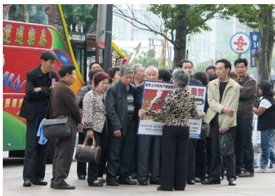
▲ 海外真相点（左起）：香港、台湾、巴黎、澳门

听了这番话，游客们都感动不已，说：这是法轮功告诉我们救命的路。一位国企老总说：“既然有出路，干嘛不选择呢？你说的，我们信，听你的。给我退党吧。”一次，一车“八零后”的游客瞪大眼睛听着，有人骂中共：“它是流氓！”“是魔鬼！”一车二十多人，问一个退一个，没有不退的，包括导游都退了。