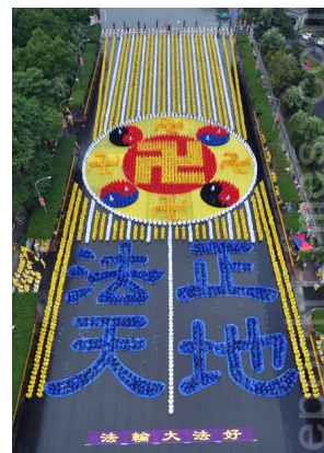
台湾历年排字炼功精选