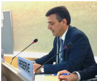
卡洛斯·伊克雷西亚斯，在联合国人权会议上发言

【明慧网】在 2013 年日内瓦联合国人权理事会大会上，西班牙人权律师卡洛斯·伊克雷西亚斯点名中共前党魁江泽民是迫害法轮功的罪魁祸首，并曝光了中共活摘法轮功学员器官的暴行，受到举世瞩目。