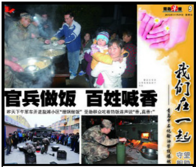
《青岛早报》对灾情的报道

原来中宣部早有禁令：对于青岛爆炸事故，各媒体严格把握正确导向，一律不准派记者赴事故当地采访，报道必须根据权威信息。网络和平面媒体不要集中归纳以往的重大安全事故，不渲染，不炒作，不发不负责任的评论，不要猜测事故的原因和责任。