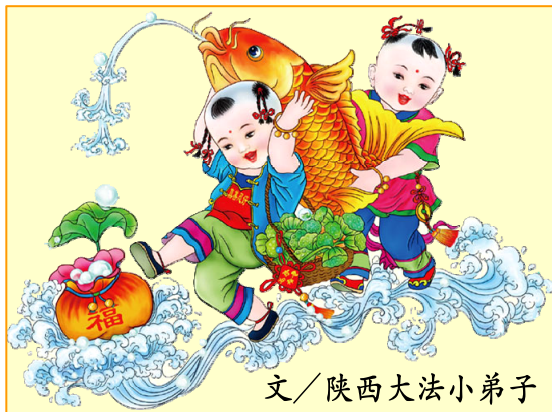
文/陕西大法小弟子

修炼大法后，我不但身体好了，而且更加聪明。四岁时就把小学一年级的知识基本学会，能熟练的读、写所有的汉语拼音字母，会算一百以内