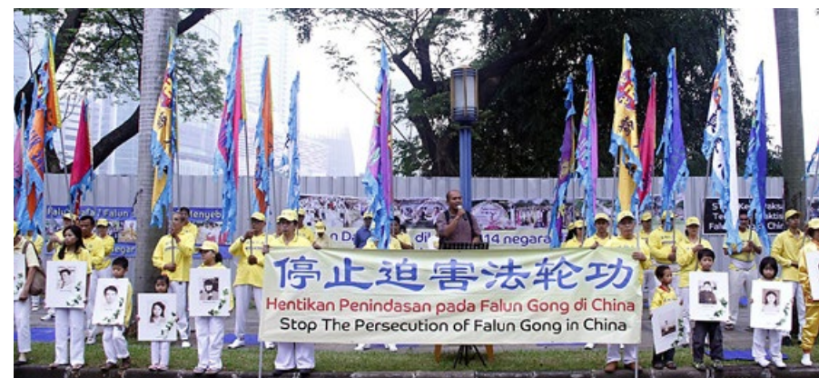
印尼 法轮功学员和平集会抗议中共迫害。