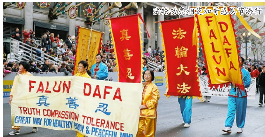
法轮功亮相芝加哥感恩节游行