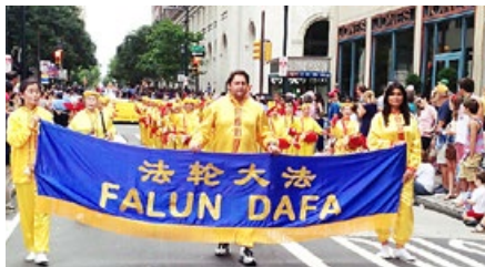
法轮功学员连续第 13 年受邀参加美国费城国庆日游行。