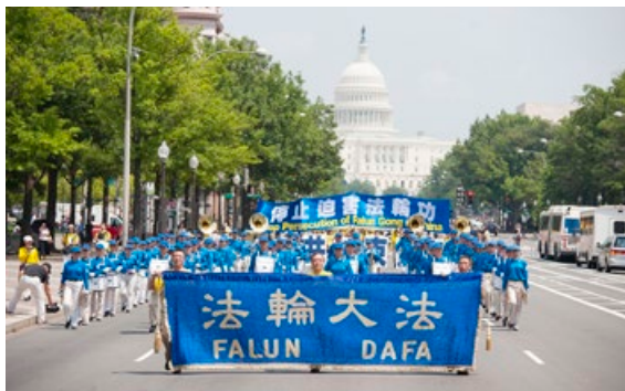
法轮功学员行进在美国国会与华盛顿纪念碑间的主干道上。

14年前的7月20日，中共江泽民政治流氓集团发动了对法轮功的疯狂迫害，中国大陆和海外的法轮功修炼者则开始了反迫害、讲真相的历程。14年后，法轮功学员广传真相，赢得了越来越多的正义支持，也给世间带来光明和希望。