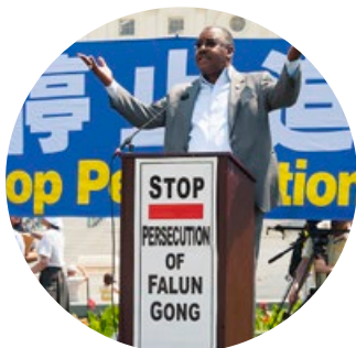
奥巴马政府高级顾问 对法轮功学员充满钦佩