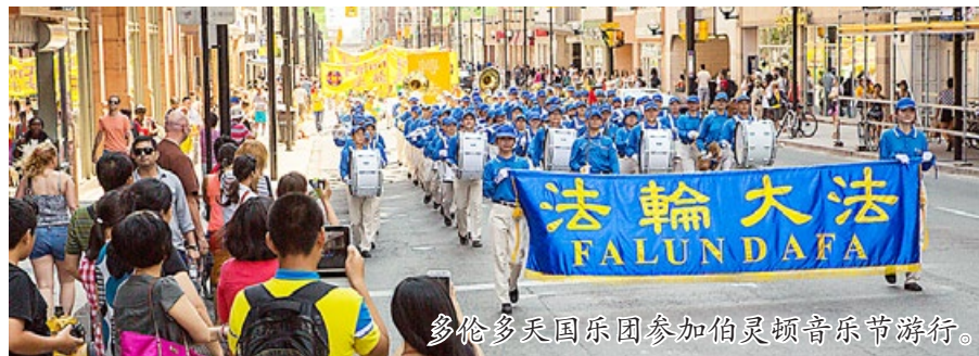
多伦多天国乐团参加伯灵顿音乐节游行。

加拿大曾多次在联合国人权委员会提出对法轮功受迫害的关注。2013年6月5日，在联合国人权委员会的23次分会，加拿大代表团再度提出对法轮功在中国受迫害的关注。在公开反对迫害的同时，加拿大总理哈珀连续8年为法轮大法日和法轮大法月发来贺信。哈珀总理在信中说：“在过去的20多年间，全世界无数的人受益于修炼法轮大法。我赞扬加拿大法轮大法学会和加拿大人分享你们的功法。法轮功的核心理念真、善、忍在我们多元文化社会中引起了强烈的共鸣。”