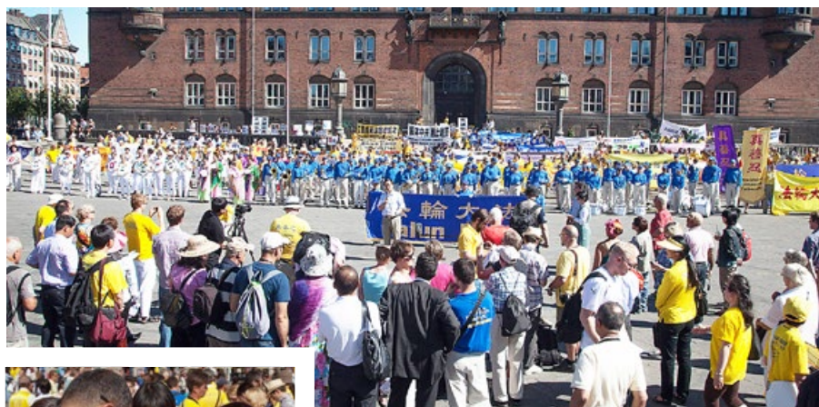
欧洲法轮功学员丹麦市政厅广场前集会反迫害。