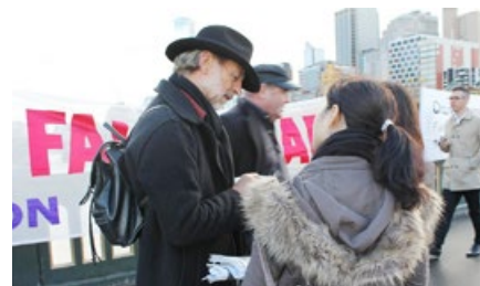
澳洲著名的诗人大卫·哈勒特先生在请愿信上签名。

足迹遍及艺术节、大中小学、作家沙龙、电台电视台，作品经常在澳广电视和电台以及澳洲SBS民族台播放的澳洲著名表演诗人大卫·哈勒特先生，当天听了法轮功学员的介绍后，立即在制止中共活摘器官的请愿信上签名。