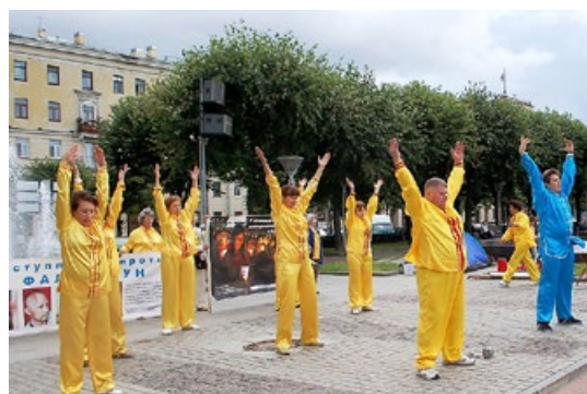
俄罗斯 法轮功学员集体炼功，呼吁各界人士共同制止中共暴行。