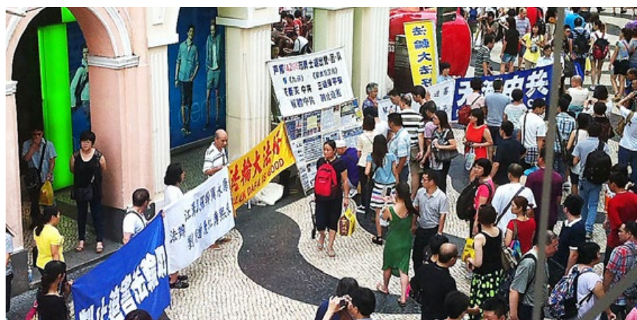
澳门 法轮功学员抗议中共迫害。