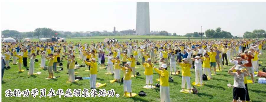
法轮功学员在华盛顿集体炼功。