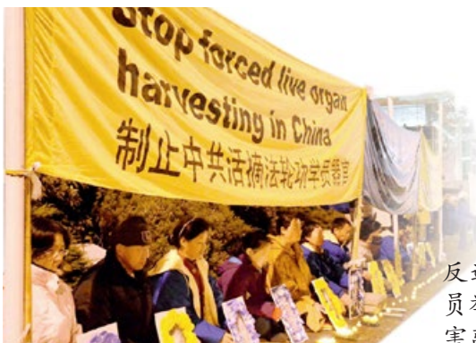
反迫害 14 年， 新西兰 法轮功学员举行烛光守夜，悼念被中共迫害离世的大陆法轮功学员。