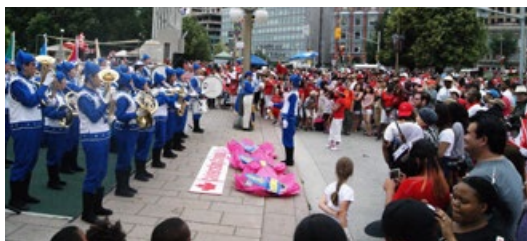
由法轮功学员组成的天国乐团在表演，和民众同庆加拿大国庆。

加拿大总理史蒂芬·哈珀在当天的演讲中诠释了使加拿大成为全球最佳国度的精神——富有同情心、勇敢、自信、自由和亲善。他强调了对价值观和民族