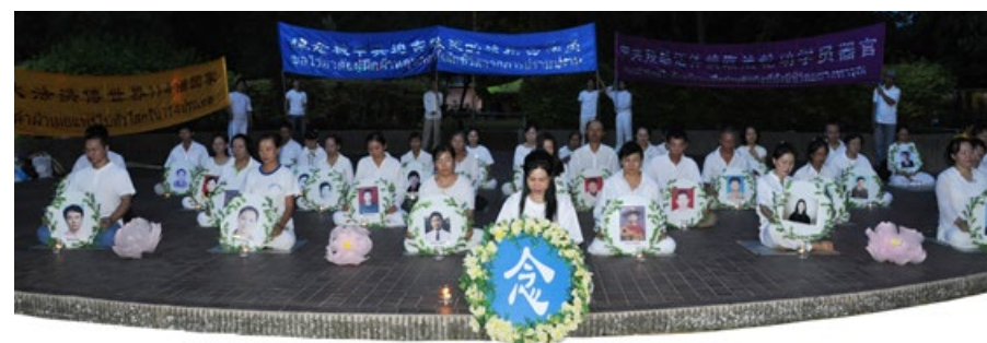
7 月 20 日， 泰国 法轮功学员在曼谷是乐园举行集会，并到中共使馆对面静坐，悼念中国大陆被迫害致死的法轮功学员，抗议中共对法轮功长达 14 年的迫害。