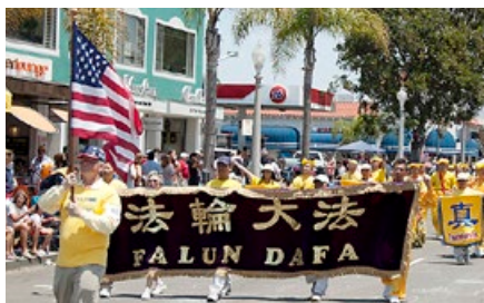
法轮功学员美国圣地亚哥游行。