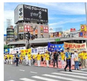
7 月 15 日，法轮功学员在 日本 东京的繁华商业区新宿举行了游行集会，谴责中共对法轮功的残酷迫害，呼吁各界共同制止中共的暴行。