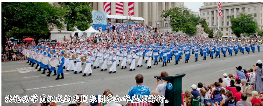
法轮功学员组成的天国乐团参加华盛顿游行。

法轮大法提倡的“真、善、忍”被各国有识之士视为全人类的共同行为规范和道德基石。许多西方人激动地说：“法轮大法属于全世界，世界需要‘真、善、忍’。”