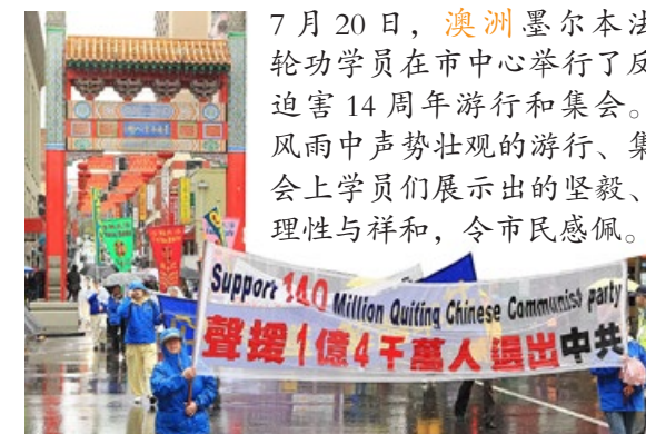
7 月 20 日， 澳洲 墨尔本法轮功学员在市中心举行了反迫害 14 周年游行和集会。风雨中声势壮观的游行、集会上学员们展示出的坚毅、理性与祥和，令市民感佩。