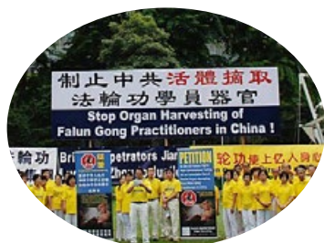
2013 年 7 月 17 日， 新加坡 法轮功学员在芳林公园举行集会，呼吁各界人士共同关注和制止中共对法轮功的残酷迫害，法办迫害法轮功的中共江泽民流氓集团。