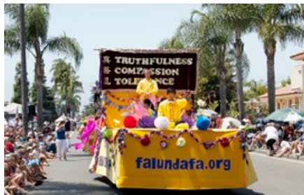
法轮功学员芝加哥国庆日游行。