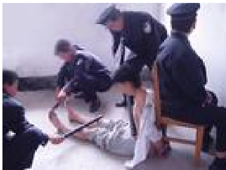
酷刑演示：高压电棍电击