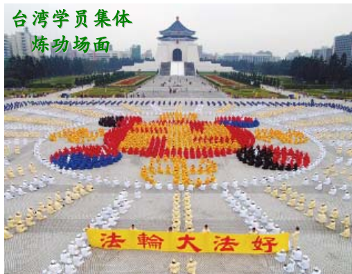
台湾学员集体 炼功场面