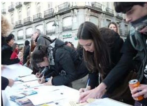
西班牙法轮功学员在太阳门广场举行反迫害征签

路过这里的人们都非常愿意接受法轮功真相的信息并签名反迫害。一位会讲西班牙语的法国人说，他认向人们展示横幅和图片来揭示