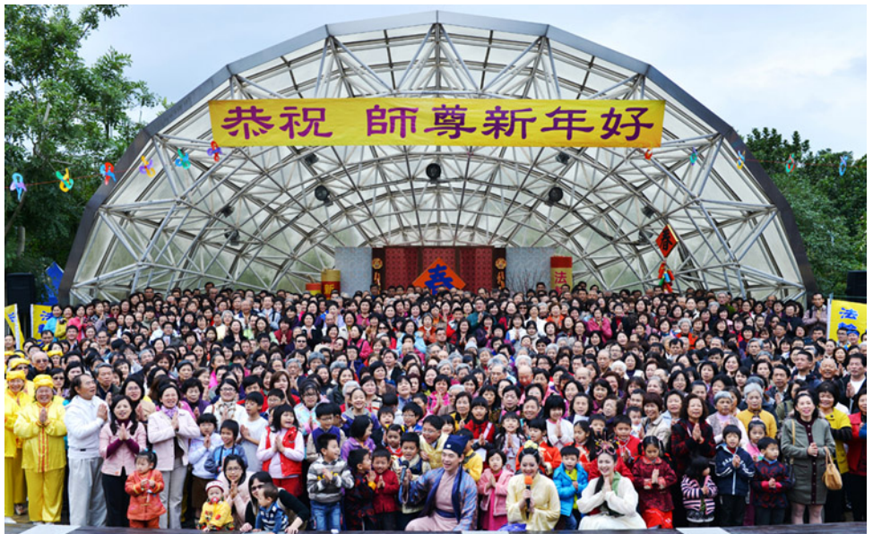
上图: 加拿大温哥华法轮大法学员向师父拜年, 表达感恩之情