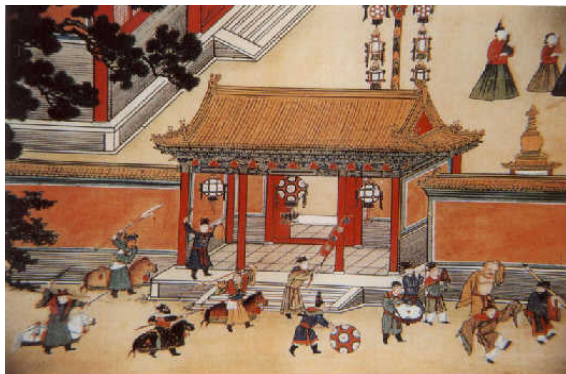
图：元宵节宫廷娱乐图

木、玉佩、丝穗、贝壳等材料，经彩扎、裱糊、编结、刺绣、雕刻，再配以剪纸、书画、诗词等装饰制作而成。按造型分，有梅花灯、荷花灯、仙鹤灯、长鲸灯、玉兔灯等，还有用灯彩堆叠悬缚而成的灯轮、灯树、灯楼、灯山等大型灯景。各种各样的灯，形态千变万化，不仅制作精美，而且灯上画着著名的神仙故事和历史故事，蕴涵着历史文化、伦理道德、审美意识、价值观念等丰富内容。届时君臣百姓都去观灯或猜灯谜，传统文化的内在精神，敬天敬神、从善如流、弘扬正气等道德理念深入人心，使人从中受到智慧的启迪，所以流传过程中深受社会各阶层的欢迎。如：一团和气灯、和合二圣灯、三阳开泰灯、四季平安灯、五子夺魁灯、六国封相灯、七擒孟获灯、八仙过海灯、九子十成灯、十面埋伏灯，还有各种佛灯、道灯、子牙封神灯、孔明灯、唐僧取经灯等，举不胜数，讲述的都是儒释道传统文化故事，灯面上绘有神仙、历史人物及各种场景，令人赏心悦目，益智增慧。