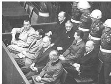
图：纽伦堡审判图片。 1945年二战结束后，纽伦堡国际军事法庭否决了迫害帮凶们“奉命行事”的辩解。

其实中共在迫害法轮功的过程中，“不提供书面文件依据”的本身，就为“一线人员”将来当替罪羊埋下了伏笔。如果追究起来，那些幕后的人根本不会承认是他们领导、命令了这一次又一次的迫害。最后的证据，就是“一线人员”错误运用法律，侵犯了法轮功学员的合法权利。然后其党再叫嚣，这些一线执法人员损害了“党”和国家的形象、给“建设事业”造成了巨大损失，云云。那些参与迫害法轮功的人员可能没有想到，中共在迫害法轮功的过程中，早把他们当成随时可以抛弃的棋子。◇