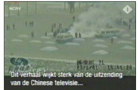
图: 荷兰国家电视台 2005 年 3 月 14 日在「时事评论」揭露了中央电视台「自焚」伪案, 质疑两辆警车为何备有二十多个灭火器。