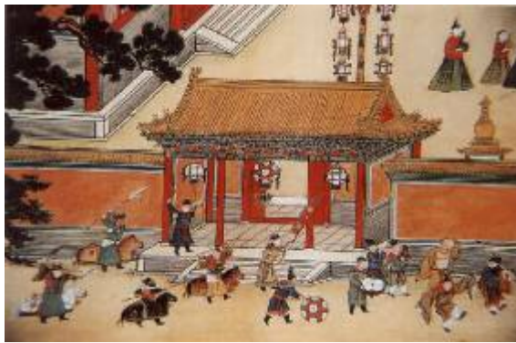
图：元宵节宫廷娱乐图

相传元宵燃灯的习俗起源于道家祭神礼仪，道教曾把一年中的正月十五称为上元节，因这一日为上元天官赐福之辰，故上元节要燃灯庆祝。秦末时亦有“正月十五燃灯祭祀道教太乙神”之说。汉武帝时，把对“太乙神”的祭祀活动定在正月十五。汉明帝时，明帝为了弘扬佛法，下令正月十五夜不论士族庶民，一律“燃灯敬佛”，以示对神佛的尊敬和虔诚。此后，正月十五夜燃灯的习俗随着佛、道文化的影响扩大逐渐在我国展开来，历朝历代都以此为一大盛事，各种活动也更加丰富多彩。